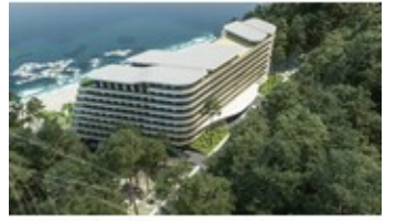
Patro 2 - Apartmán K2-A.18