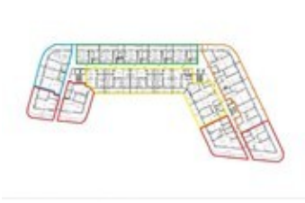
Patro 2 - Apartmán K2-A.19