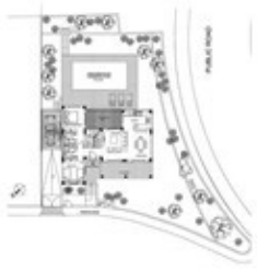
FIRST FLOOR |